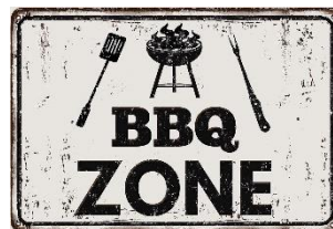
Gezellig keuvelen en eten

Voor ons was dit weeral OK Meer moet dat niet zijn